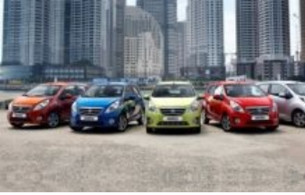
Пока ещё Daewoo