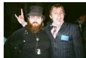
С доктором Кроу

Кроме того, летающий череп у ГГ в подручных явно намекаэ на