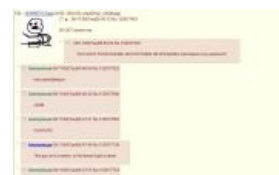
Нотариально заверенный скриншот