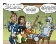
Казалось бы причём тут Бендер