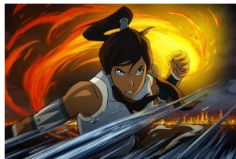
Гюльчатая таки показала личико

И это при том, что официальных™ артов с лицом Корры тогда еще не появлялось