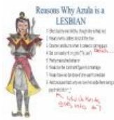
Почему Азула — лесбиянка

https://www.youtube.com/watch?v=d8urXdyee7g Catch Avatar - Bending Battle