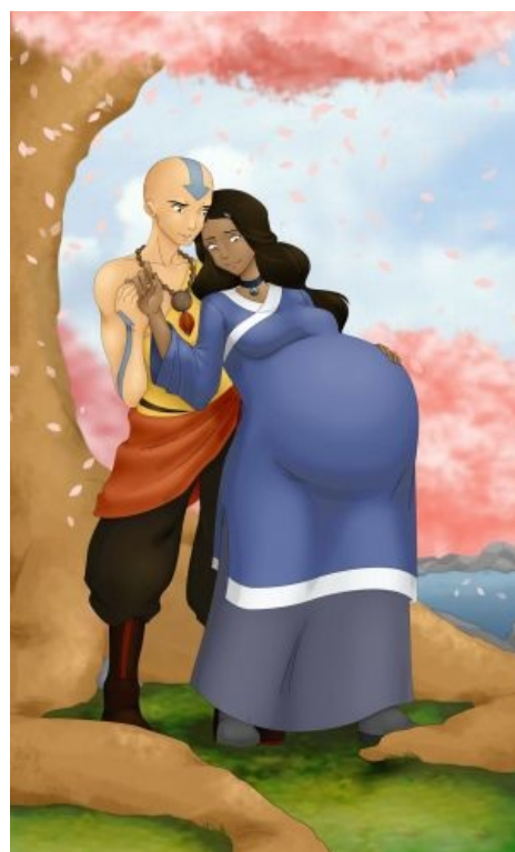
Концовка глазами катаангера

Выход сериала породил бурю ненависти у особо двинутых фанатов оригинальной серии. Они наводнили тематические интернет-гневным ревом на тему: «аватар уже не тот», «мир так быстро меняться не может», «Корра бездуховна» и «верните нам Аанга!!!» Таки недостатки в новом сериале есть, но, не считая гомосрача, кроются они во второстепенных персонажах; например, старый хохмач дядя