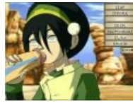
Тоф и кхм... Аанг