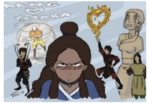
Шипперы любят Катару

Зутара, косплеер-лесбиянка и художник-тян в одном лице