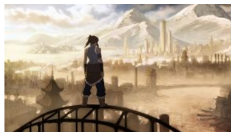
Первый официальный арт