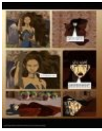
Мечта Зугара — убить Мэй