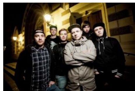
Успешные рэперы смотрят на тебя.

Дебютный альбом под названием «Смачные ништяки » банда выпустила к 2009 году, быстро, решительно он был залит на gar.ru и высоко оценен местной публикой. Anacondaz сумели выиграть несколько рэп-баттлов сайта. Первый диск был несколько проще их последующих творений — выходить в свет с ультраэкспериментальными текстами они не решились, работа на респект тогда была превыше всего. В Эстонии анакондовцы познакомились с уважаемым ими Noize MC , тот одобрил их деятельность, замолвил словечко перед журнализдами , пригласил в Москвабад и запил с ними совместный фичеринг « Похуисты ». После сотрудничества с Нойзом на ранее малоизвестных ЭмСи с окраины этой страны посыпался шквал предложений дать концерт и съездить на гастроли по городам Ройсси и Украины . Вскоре коллектив осел в DC . Сами участники объясняют свою понаехавшесть тем, что за МКАДом пробиться гораздо труднее, а в мегаполисе живёт гораздо больше народу, способного заценить музыку по достоинству.