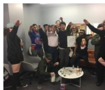
/pol/тарды как они есть

Кроме того, ультрайт-каналы в огромном количестве присутствуют на ютубе , который и является главной площадкой для их пропаганды. Всех