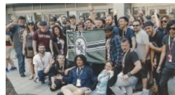
Только посмотрите на эти истинно арийские лица!