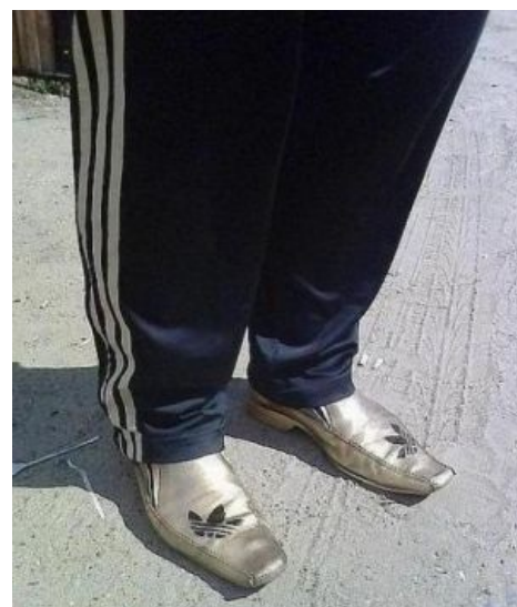
Сабж прижился в этой стране