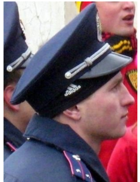
Перековка гопника в мусора не прошла бесследной