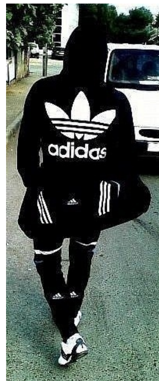
Адидас головного мозга

| Сегодня носит Адидас, а завтра Родину предаст (продаст) — Поговорка 80-х