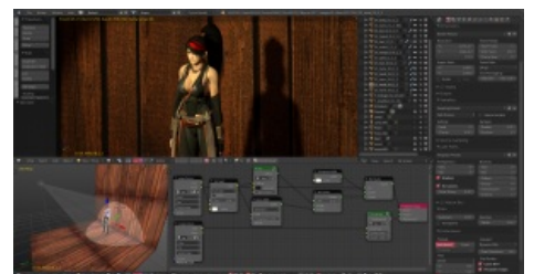
Blender 2.69 после некоторой настройки

Проявляется в том, что возникают сложности при элементарных операциях: выделение объектов и полигонов — всегда выбираются какие угодно, только не нужные пользователю, добавление точек на сплайнах может происходить в произвольном месте, UNDO может не работать где угодно (например в Loft не работает с 2008 версии по 2014!), операции разрезания полигонов (Cut, Quick Slice) могут глючить в