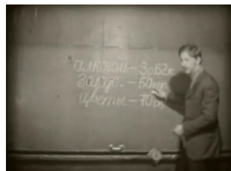
Советские студенты в теме.