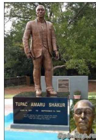
Из натурального чёрного шоколада, кстати.