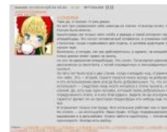
Нотариально заверенный скриншот

11 октября 2014 — хохол Степан-шинкуфаг, преданный три года назад обезьяной, решил отомстить и встроил в куклоскрипт автоскрытие крымотредов по нескольким ключевым словам. В ответ на это обезьяна подсветила все посты с куклоскрипта красненьким , а потом заблокировала куклу по всей борде. Позже было разрешено пользоваться скриптом в тематике, блокировка распространяется только на /b/.