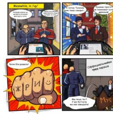
Краткая суть событий в /vg/

10 октября 2012 — сомалийский фильтр засуспендил домен 2ch.so по неизвестной причине. Пока основные адреса 2-ch.so и 2-ch.ru.