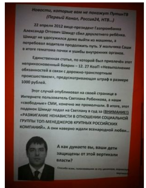
Еще один случай