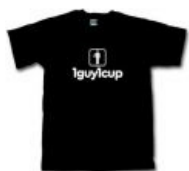
Майка для фанатов