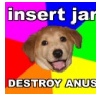
ВСТАВЬ БАНКУ @ УНИЧТОЖЬ АНУС