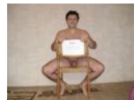
Только на первый...