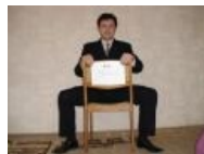
А на первый взгляд — приличный человек