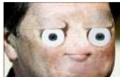
Смотрите, да это же т т

т — буква из письменности дравидского языка каннада, никому, кроме 50 миллионов индусов, не известного. Читается «ттха». Японский анонимус с 2channel, копаясь в дебрях юникода, нашёл эту букву и начал использовать форсить единственным известным ему образом — как смайлик. Оттуда и пошло.