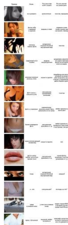
Расстановка точек над аватарами.