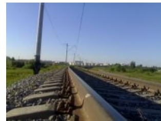
А власти скрывали. Экспериментальное кольцо на фоне Бутова

Станция же Бутово разговор совершенно отдельный, ибо возглавляет список ебанутости населения вместе взятых С. и Ю. В местный битцевский лес, разделяющий Северное, Южное и станцию частенько залетают мигалки (с заготовленной шоу-программой), ультрапацанские джипы и просто разные обыватели, вот так вот...погулять в лес на моторе. Существует необъяснимая хуйня, по которой каждый приехавший на район, никогда не укладывается в сроки возврата с сего, по разным причинам.