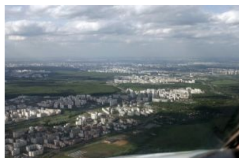
Бутово, вид вдоль

Южное Бутово ( Бутово, Южно-Ебутово, место, где ебут обуто , а также Южное Быдлово ) — особый район сначала на окраине, а после расширения — в самом центре Москвы , де-факто находящийся в замкадье за МКАД. Известен среди москвичей как заповедник непуганой гопоты с самым большим поголовьем. Однако имеет метро, так что путь в центр у местного пролетария отнимает всего час жизни. Среди широких масс приобрёл некоторую, уже подзабытую известность после рекламы местных трущоб в телевизоре и последующих упоминаний сего уютного местечка в популярных юмористических передачах . А ещё именно здесь находится так любимая либерастами улица в честь «невинно убиенного» Ахмата Кадырова .