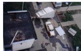
Типичный вид из окна

Южно-Ебутово — типичный новый район Москвы, построенный при Лужкове . Окружён глухими лесами, возведён в поле на прочно укатанных в землю руинах заброшенных деревень; в парках по реке Чечёре до сих пор встречается сливы и яблони с тех огородов. Массивы жилых зданий перемежаются посёлками. Огромные продуваемые пространства между серыми бетонными коробками засыпаны мусором. Небо со стороны Москвы всегда затянуто паром Южной ТЭЦ и дымом пожаров, зато в нём удачно проходит трасса захода на посадку лайнеров аэропорта «Внуково», поэтому желудки и квартиры аборигенов периодически сотрясают мощные басы двигателей Боингов и прочих Туполевых. Облака несгоревшего керосина вперемешку с пылью МКАДа лежат на крышах, поэтому небоскрёбов в районе нет. Как и любой спальный быдлорайон на окраине, Бутово отличается совершенно поехавшими ценами на квартиры, которые зачастую удельяют такие места, как «элитный» Кутузовский. Сами бетонные коробки, несмотря на цену квартир в них в сотни тысяч долларов, выглядят красиво только с расстояния более пятисот метров — при ближайшем же рассмотрении становится очевидна их чудовищная убогость, в частности, слабопромазанные цементом стыки панелей, вызывающие у наблюдателя ощущение, что дом сейчас сложится.