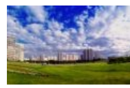
Приглашенное Бутово (Северное)