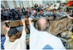
Быдло из Бутова рвётся в Нерезиновск

На заре становления Южного Бутова среди молодёжи были популярны хождения микрорайон-на-микрорайон, погони по дворам с ножами и топорами, наезды в Бутово внутримкадных фашистов и прочих исследователей большими организованными группами. Такие рейды сопровождался крупным шухером и полками милиции , наводнявшими дворы и подпирающими столбы вдоль дорог. Довольно скоро внутримкадышам стало понятно, кто хозяин этой глуши, и массовые въезды прекратились. Чего, однако, нельзя сказать о всяких любителях погулять. Те из