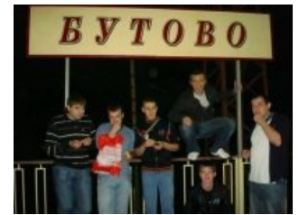
В Бутово можно попасть и на электоропаровогах

На данный момент имеет обширную историю. Всё это время Южное Бутово сосёт и курит в сторонке, изредка опиздюляясь от Северного. На 2010 год не существует никакого примирения между тремя районами Бутова. Общим названием «Бутово» называют только не местную утварь. Южное же считается бомжрайоном с ахувшими малолетними барыгами, не менее ахувшими таджиками и понаехавшими настоящими лимитчиками, получившие хатули. Также Ю.Бутово срётся приезжать в С.Бутово по необъяснимым причинам... видимо, не хватает сплочённого количества человек. Мусарка в Ю. и С. Бутовах одинаково ахувшая, так, например, за найденный у вас грамм чего-то покурить, с вас мило попросят 10-20к. Шакалы палят по подъездным окнам и устраивают целые шоу при приёмах. В С.Бутово существует местный «бойцовский клуб» под названием КРУЗО. Здесь собирается контингент, которому интересно не только нажраться/схватать/употребить и потанцевать, но и также дать/получить/посмотреть пизды, не зависимо от погон/званий/статусов/возраста/пола и т. п.