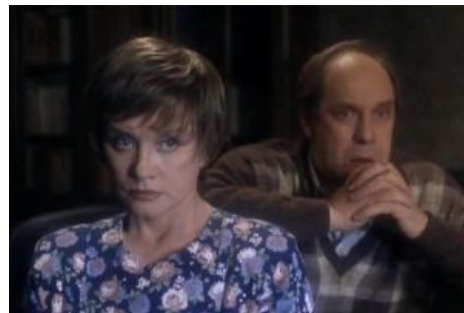
Вера Алентова смотрит, как ебут в жопу Марию Шнайдер.