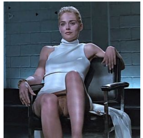
Ради этого и смотрели полфильма.