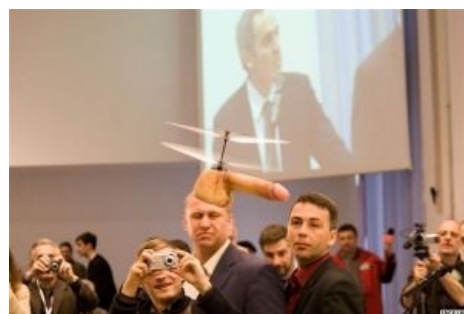
Летающие хуй? Запросто!