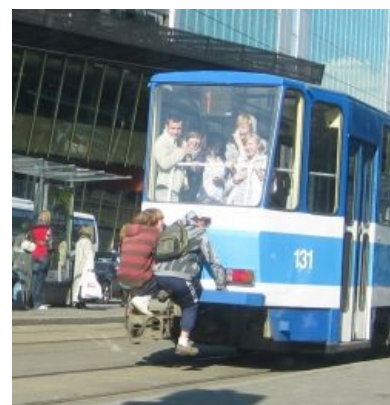
Школота атакует места для VIP

Что касается зацепинга, эта забава на трамваях зародилась ещё в дореволюционные годы как способ проезда зайцем и, само собой, завоевала у школоты дикую популярность (до развала совка зацепинг на трамваях был даже популярнее, чем на электричках). Ввиду характерной