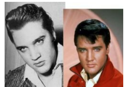
Операция на носик

Сразу после армии Элвис решает серьёзно посвятить себя кино . Он делает операцию на своём носу, что можно лицезреть, сравнивая его фотографии в период «до» и «после» кошмарного альбома «Elvis is back!». Снимается в дюжине кинофильмов; и, несмотря на нездоровую критику в их адрес, они имеют вполне огромную финансовую выработку.