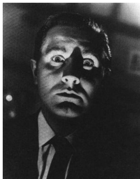
Афтар собственной персоной