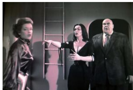
Кадр из фильма «План 9»