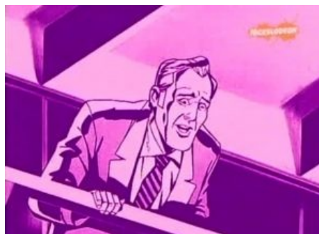
Один из персонажей смотрит куда-то как на что-то