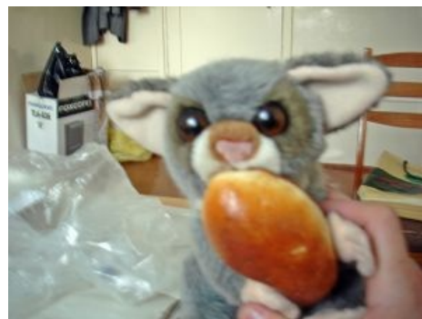
Шушпанчик ест пирожок