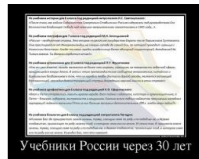
Школьные учебники недалёкого будущего

В 2011 году чиновники решили, что школьникам мало двух уроков физкультуры в неделю, и ввели третий. Это обрадовало и учителей (надо менять расписание уроков, да и проводить урок надо не с одним-двумя классами, а с двумя-тремя-четырьмя, и попробуй организуй соревнование или ещё какую-нибудь поебень), и школьников (сидеть в тюрьме на час больше, хер переоденешься на физру). И если раньше на физкультуре тупо бегал весь класс, то теперь пол-класса сидит на скамейках, а другая половина бежит — спортзалов то не прибавили, и количество квадратов на человека почему-то не увеличилось. Описывать, ЧТО творится в раздевалке, рассчитанной на 10-15 человек, до и после урока не надо — всё и так понятно. Ибо в правительстве хотели как во всех цивилизованных америках и европах, а получилось как всегда . Алсо, именно третьей физкультуре одиннадцатиклассники обязаны своими 37 часами и семью уроками. И это не может не вызывать butthurt . Также это вызвало такое ужасное явление, как теоретическая физкультура. Чаще представляет собой странное мероприятие, где все ученики либо страдают хуйней, либо делают абсолютно бессмысленные действия. Выглядит это, как изучение езды на велосипеде без, собственно, езды. Ну, или как служба в ВВС без (хотя бы) наблюдения самолетов.