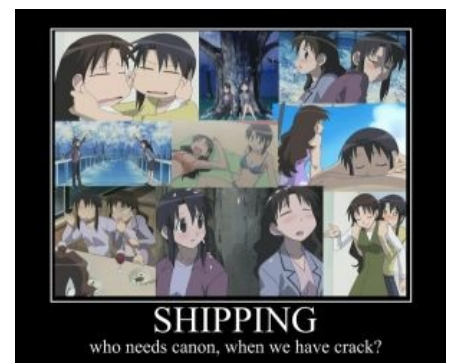
Зачем канон, если есть крэк?