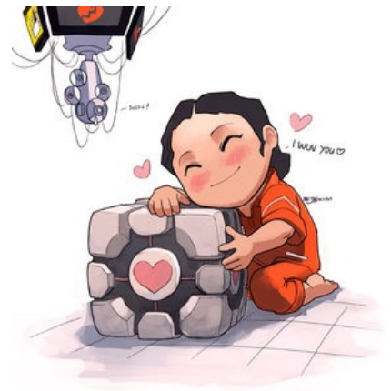
Челл с кубом — всё по канону.

Поскольку здравый смысл и логика используются мозгом шиппера в последнюю очередь, то на просторах интернетов появляются такие экзотические варианты пейринга, которые в голове у здорового человека не возникли бы никогда. Вот несколько простых правил, по которым может быть выбрана пара. Хотя правилами их назвать сложно, потому что состоят они целиком из взаимоисключающих параграфов . Итак, два персонажа могут быть парой если они: