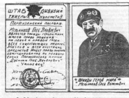
Рис. 7. Больной, страдающий яркой выраженной формой прогрессивного паранойи

Шизофрения позволяет художнику взглянуть по-другому даже на КОТЭ