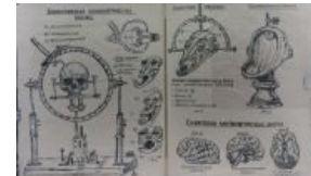
Прогрессивный метод диагностики