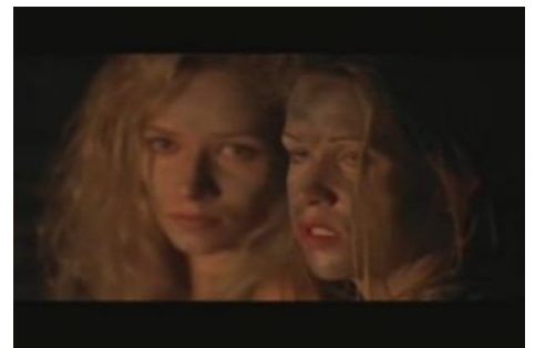
Прекрасные постапокалиптические девушки.