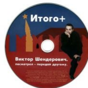
Тот самый агитационный диск

В 2005 году Шендерович плюнул на все и пошел в большой политик, то есть в Думу. Большой политик повернулся к Шендеровичу задницей, и тому пришлось пройти мимо. Предвидя грядущий фейл, данный поход за зипунами Виктор Анатольевич назвал социальным экспериментом ( запись от 03.10.2005 : «Этот двухмесячный марафон прошу считать публичным экспериментом свободного журналиста в не очень свободной стране»). Ну а что еще оставалось делать, когда были такие помощники ? К слову сказать, баллотироваться Анатоличу почти никто не мешал и даже в ЦИКе не развернули, но, неожиданно для всех, злым гением этой страны оказался не кто-нибудь, а как раз он. Ну и попутно еще припомнили всех евреев, когда-либо мелькавших вблизи от политики (например, тут и тут ). И ZOG конечно. А еще немножко шантажировали. Подробности — в «Недодумце» .