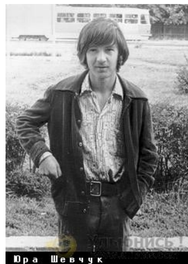
Юрочка в пубертатный период жизни