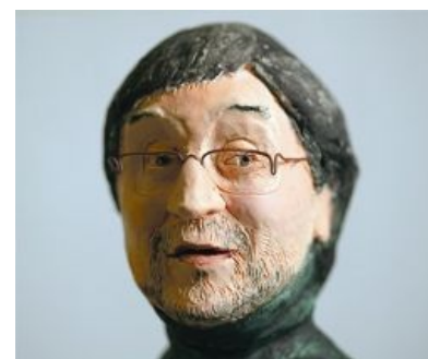
Щенок, ты что-то понимаешь