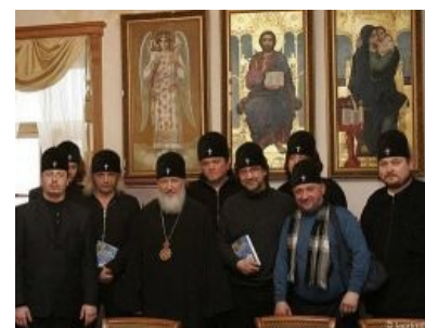
Сайд-проект Кинчева и Шевчука

| — Да, вроде бы пою... — Твои коллеги — дрянь, да пидорасы. Я этот юмор бы собрал разок в