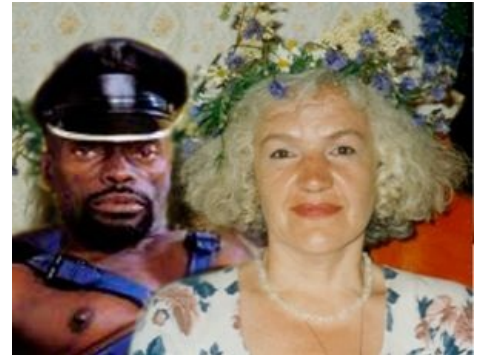
Извра-Тина и ее новый деревянный дильдо. Они смотрят на тебя, как на Пусю.