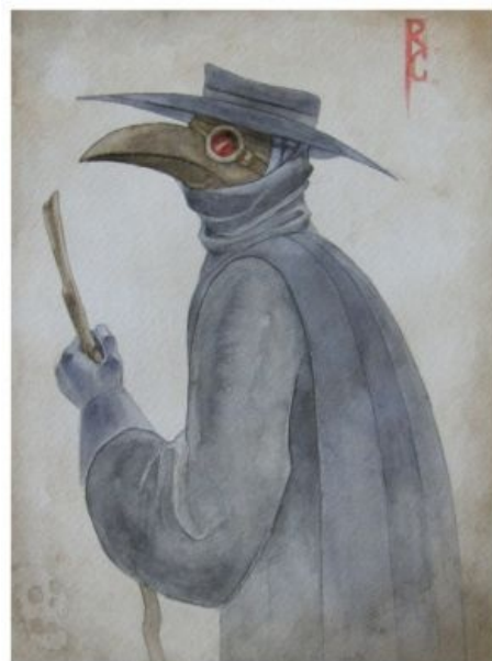
На что жалуемся?