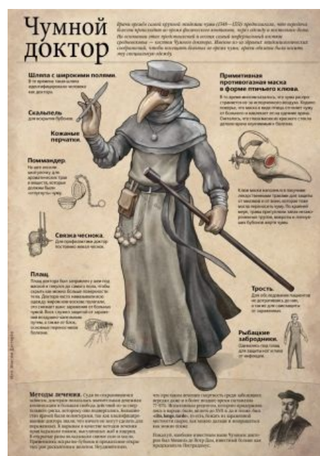
Такой вот типаж