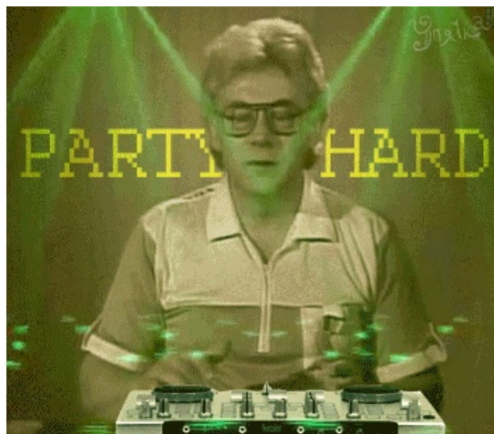
Party Hard , уячкоёбская версия

И еще как идет! Когда в конце восьмидесятых Кашпировский и Чумак действительно ведь усыпляли многих, болячки у некоторых и вправду заживляли, заряжали воду и т. п. — к этому быстро привыкли, миллионы людей ощутили эффект на себе, и никто уже особенно не удивлялся. Врачи в основном не верили и ругались, многие после передач обращались к ним с явным ухудшением здоровья, — но ведь это тоже эффект, отрицательный, но наиболее достоверный: его традиционная массовая медицина фиксировала. И не только гипноз, не только внушение: а тот америкашка, который по телевизору зрителям вставшие часы