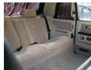
Ранний вариант «Чайки»