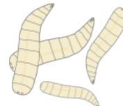
Сферическое червие в вакууме