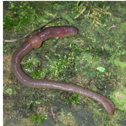
Земляное червие такое червие

Обычное червие не заводится на говнах и не кипит в душах (питательная среда не та , да и вообще...) Напротив, опарыши заводятся вполне себе радостно, да так, что субстрат начинает пучить и он расползается во все стороны десятками тысяч кавайного червья.