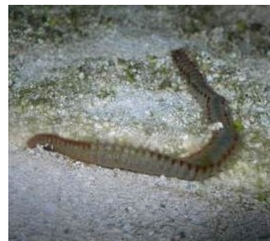
То самое аквариумное червие

| Вот такое червие, Хотел бы его сохранить... Вот такой зверь пришел с камнями. У меня ведет себя смиренно — выползает только поесть со дна, когда кормлю рыб. Однако, несколько смущает его размер — где-то 15-17 см.