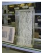
Longworm is looooooong!