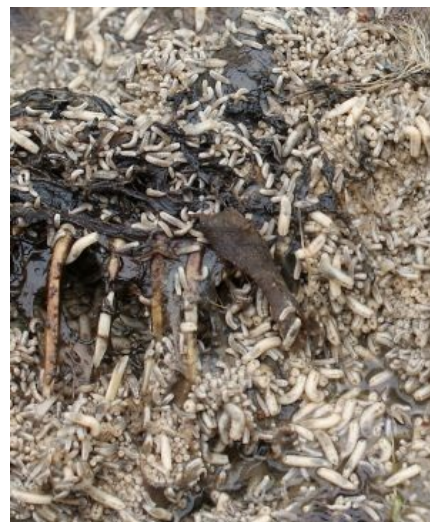
Червие в самом соку