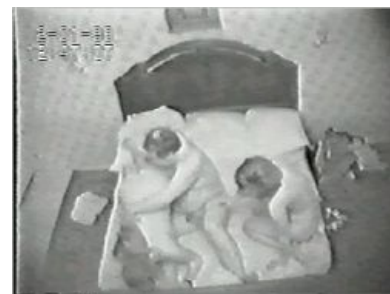
Человек, похожий на Скуратова (сверху)

« Человек, похожий на прокурора », а точнее, «человек, похожий на генерального прокурора» — крылатая фраза, произнесенная в 1999 году в авторской программе Сергея Доренко . На видео человек, похожий на тогдашнего генпрокурора Скуратова, с двумя девушками, похожими на шлюх, занимается процессом, похожим на секс, в месте, похожем на баню. Видеоплёнка была показана в эфире российского центрального телевидения, а фраза использовалась ведущим как эвфемизм вместо «Юрий Скуратов, генеральный прокурор РФ». Фраза была растиражирована в СМИ, а впоследствии словосочетание «человек, похожий на...» стало устойчивым выражением.