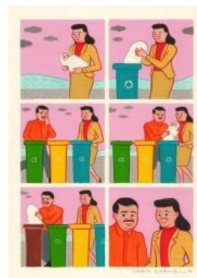
Корнелла в детях знает толк