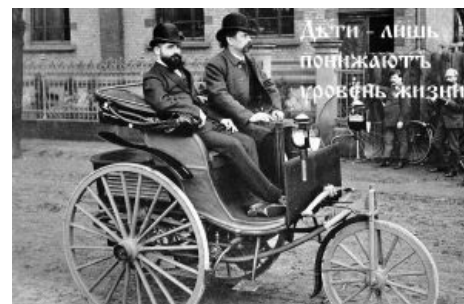
Господинъ, добившийся успеха