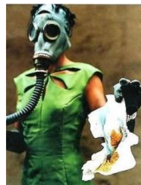
Кошмарный сон ЧФошника

Таким образом, человек в силу личного выбора отказавшийся от детей, будет каждый день испытывать на