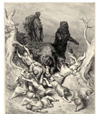
Когда он шел дорожкой, малые дети вышли из города и насмеялись