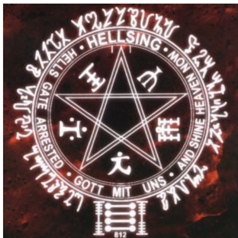
Звезда Соломона в аниме

Splitting the baby — неофициальный термин в среде американских юристов, произошёл от истории со спорным ребёнком. Значение его таково: достичь компромисса в спорном деле без судебных прений на предварительном заседании. Употребляется лишь в гражданских и имущественных делах. В бракоразводных делах данным термином обозначают тяжбу, когда надо решить, кому из родителей следует оставить ребёнка и кто будет платить алименты. Пиндостанским адвокатам подобные разбирательства зело по нраву, ибо профит.