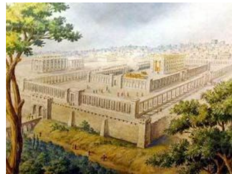
Предполагаемый вид храма

Кроме того, Сол известен строительством Иерусалимского храма, который был снесён, позже заново отстроен и снова же выпилен, и если его опять отстроят — согласно пророчеству, грядёт светлое будущее и прочие радости . Храм этот — ещё одна из священных коров в иудаизме, а знаменитая Стена плача — это всё, что от него осталось. ( спойлер : Правда в том, что Стена плача — это остаток от Второго храма, который был построен в 519 году до нашей эры, а затем реставрирован Иродом I (тем самым) и увеличен им разными пристройками .) Вся инфа о строительстве и прочем расписана на три с половиной страницы, кому охота узнать древнееврейские инженерно-архитектурные особенности, могут прочесть Первую книгу Царей, шестая и седьмая главы.