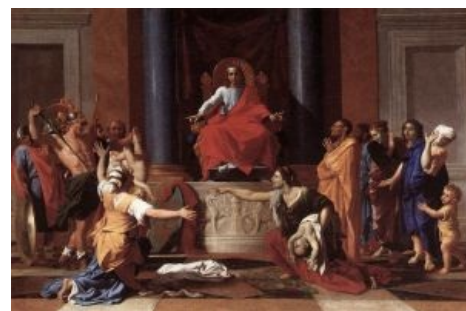
Эпический суд Соломона — иллюстрация Никола Пуссена

| Тогда пришли две женщины блудницы к царю, и стали пред ним.