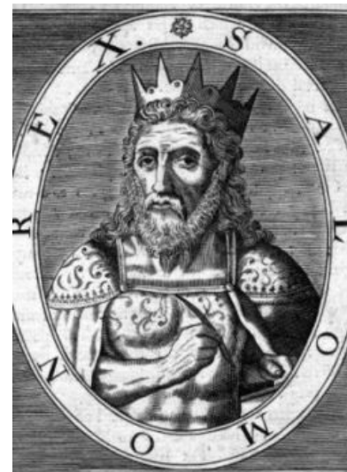
Царь Соломон видит в тебе демона.

Соломон (евр. рас. : שְׁלֹמֹה Шломо , англ. Solomon , лат. Salomon , араб. سُلَيْمَان , moon. ) — легендарный правитель Израильского царства , один из самых известных и меметичных евреев на планете Земля . Среди них самих к нему весьма неоднозначное отношение, но это не мешает многим таки да и таки нет завидовать его успеху. Алсо православный святой — память в последнее воскресение перед Рождеством. Почитается также и в исламе как пророк под именем Сулейман ибн Дауд. По большому счёту, можно назвать Соломона третьим по меметичности после Спасателя и языкатого Алика.