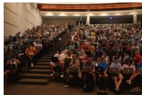
Хомячки, объединённые любовью к яблопродукции

Примерно с середины двадцатого века страны Европы и США начали входить в постиндустриальную стадию, когда основные материальные потребности населения, необходимые для комфортного выживания, удовлетворены полностью. Но людьми надо по-прежнему управлять и куда-то направлять их творческий зуд, так появилась развитая индустрия рекламы, убеждающая людей покупать то, что им не нужно, и соответственно продолжать с неутраченной интенсивностью играть в зарабатывание денег. В этом аспекте получило распространение наименование хомячками наивных потребителей, ведущихся на разного рода рекламные трюки и демагогию. Порой хомячковый ФГМ доходит до абсурда, когда на тело наносятся татуировки логотипов фирм ( Harley-Davidson ), создаются клубы для общения (Apple) или придумывают мессианские мифы об исключительности некой торговой марки. Как правило, хомячки покупают худший товар за большие деньги только потому, что он некой марки, или его рекламировала красивая тётя .