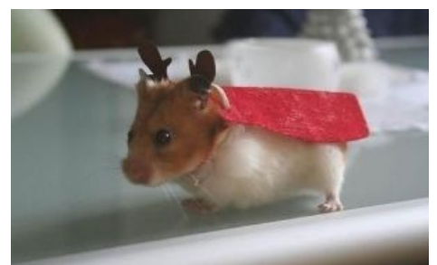
И даже у Санты они есть!