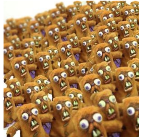
Нашествие негодующих хомячков