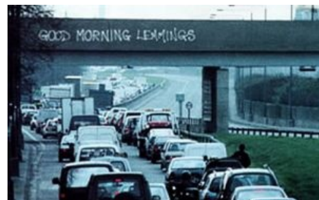
С добрым утром!

Действительно, модно, Стало ругать власть, рифмовать с оскорблениями. Политика, как ни странно, Дело тонкое достаточно. Но у лемминга все это искупается сомнением.