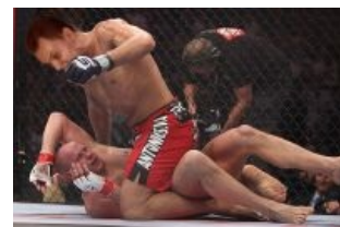
Сладкий сон Хованского

23 марта 2012 года Хованский выложил видео о Емельяненко (для исторической справки: в то время в Рунете очень форсился бой одного с Монсоном, что многих заебало и, видимо, Хована тоже). Видео сразу же заминусовала куча школоты и поцреотов , и срачик насчет него был неплохой. Особенно впечатлительные и ярые фанаты Емельяненко обещали расправу. Также доставляет тот факт, что Емельяненко так и не ответил Хованскому. Да и отвечать там, собственно, было не на что .