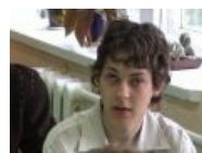
Типичный малолетний долбоёб