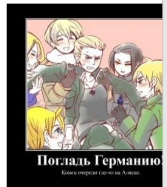
Германия срёт кирпичами.