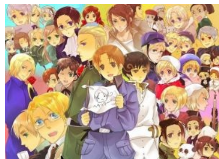
Кавайные няшки :3

Hetalia Axis Powers (moon. , рус. Хеталия: Страны Оси ) — веб-комикс за авторством Хидэкадзу Химаруи, переросший в полноценную мангу, а позже и в аниме. Пользуется большой популярностью у женской части интернет-пространства, в частности у гойщиц . Породила фагготрию тоховских масштабов в Японии и вообще во всем мире. По мотивам комикса создается фан-арт начиная с рисунков, додзинси, фанфиков , видео-пародий на популярные тайтлы и заканчивая играми и визуальными новеллами.