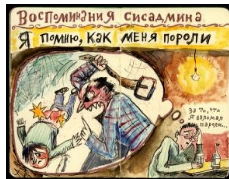
Эх, нечеча уже не то, что давеча

Гуманитарий по вызову. Разломает сервер нахер! Выбивание паролей, написание бэкдоров со сроком «вчера» силами самих разработчиков систем безопасности, общение с детьми администраторов, выезды, консалтинг.