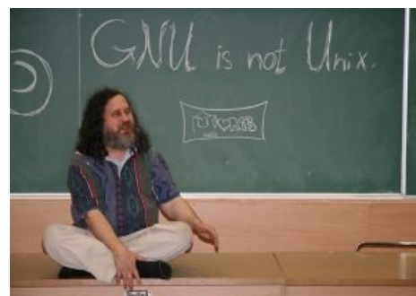
Ричард Столлман объясняет рекурсию

К примеру, trial-программа способна превратиться в полнофункциональную версию после ввода ключа. «Грязный бит-хакер» найдёт первое сравнение в коде, которое ведёт к разветвлению «полнофункциональная версия — триал» и пропатчит его на безусловный переход. Если далее выяснится, что программа