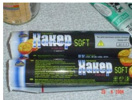
Не ешь, хакером станешь!