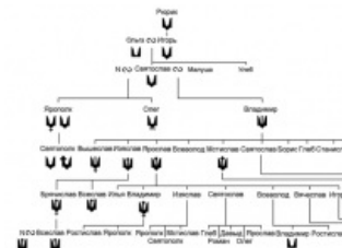
Гипотетическая эволюция рогулей.

украинский герб. В последнее же время буйство фантазии разыгралось не на шутку и вылилось в идею, что мнимый «трезубец Рюрика» есть ни что иное как хазарский символ пикирующего сокола. Идея овладела умами по обе стороны границы, породив как герб Старой Ладogi, так и шеврон батальона «Донбасс». Однако факты упрямы: первый достоверно известный нам княжеский знак — «двузубец» Святослава, который его сыновья стали творчески развивать, добавляя к нему дополнительные зубцы, кресты и т. д. Точку в споре поставил найденный недавно в Ладогe фрагмент печати времён Рюрика с изображением хищной птицы (орла либо ворона), которая оказалась вовсе не пикирующей, а нормальной, головой вверх, как у всех германцев: так, монеты с аналогичным изображением чеканились в ту пору в Дании и Фризии.