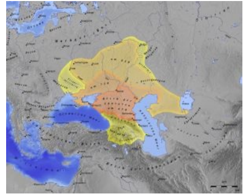
Сабж в расцвете лет