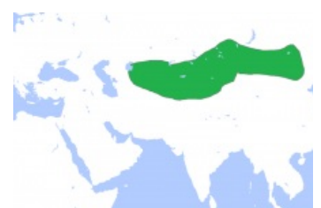
Йоба. Недозолотая орда.

Среди этих народов выделялись бывшие союзники гуннов акациры (одно из огурских племён ) и сильно отюреченные финно-угры савиры . Сии последние (при случае норовившие назваться гуннами ) сто лет подряд (с 460-х гг. по 560-е гг.) нанимались попеременно к ромеям , лазам и персам