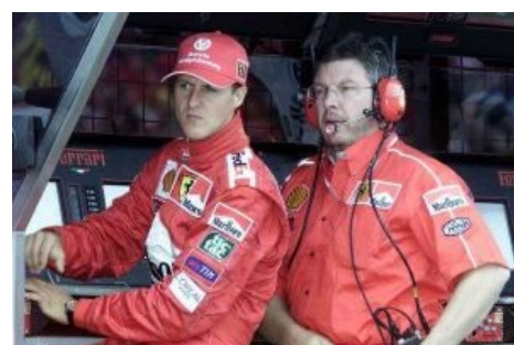
Шумахер и Браун в естественных цветах