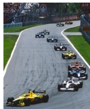
Паровозик Трулли, сферический в вакууме

Ярно Трулли ( Троль, реально троль! ) — широкомордый винодел, в свободное время гонявшийся на болидах Ф1, видимо, по чьему-то недосмотру. Будучи в целом персонажем малопримечательным, широко известен в узких кругах благодаря одноименному мему Паровозик Трулли . Суть явления заключается в сверхъестественном напряжении анальных сил на квалификации и таким образом старте в числе первых на медленной машине. Остается сколь-нибудь эффективно оборонять позицию — и сзади формируется целый состав машин, способных ехать существенно быстрее, но затролленных до заданной скорости. При этом проскочившие мимо стремительно отрываются, а шанс их догнать у пассажиров паровозика, соответственно, уменьшается с каждым кругом. Бывали гонки, в которых Трулли весело возил паровозики из Макларенов, Феррарей и прочего разноцветного зверья не то что до пит-стопа, а вообще до самого финиша. Однажды взял поул в Монако (2004 год), где обгонять почти нереально — результат предсказуем [11] . Уважаем критиками и комментаторами за фантастические навыки квалификации , ненавидим гонщиками и командами ровно за то же самое. Кто знает, каких результатов мог бы достичь сей итальянский мужчина с нормальной машиной, но, к сожалению, Тойота таковой построить не смогла и самовыпилилась, а из Рено Ярно попросили ещё до окончания сезона 2004 за отказ вторикеллить на Алонсо, любимчика Бриаторе.