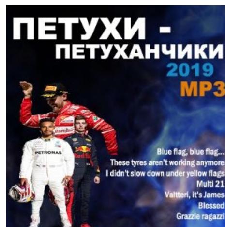
Суть™ в 2019

По характеру — весёлый распиздяй с подьёбом, что было забавно в первое время, но сейчас уже потихоньку напоминает игру на публику. Очень эмоционален (расплакался, когда выиграл первое чемпионство), а после выигранных Гран-При вопит в свое радио так, что слышит весь трек, что, однако, учитывая количество выигранных гонок, уже пахнет фальшивыми эмоциями и порядком подзаебалом. Машины свои называет женскими именами (Джули, Кейт, Грязная сестренка Кейт, Соблазнительная Лиз, Похотливая Мэнди), что символизирует. К сожалению, сильно избалован командой, что породило нихуёвую звездную болезнь.