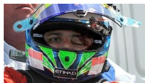
Фелипе Масса. Результат «лобового столкновения с пружиной»