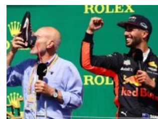
В рот мне ноги IRL.

Дэниэль Риккиардо ( Медоед, Дэн, Младокенгуру, Улыбашка, Ричи, Феттельратте, Доктор Ливси, Авокадо ) — австралиец, очередной воспитанник младшей школы Ред Булла, прямой наследник Уэббера в старшей команде. В отличие от предшественника, в 2014 сразу заставил всех говорить о себе как о потенциальном чемпионе, с первой же гонки начав регулярно опережать четырёхкратного Себастьяна, что вылилось в три победы против ни одной у Феттеля и переход последнего в Феррари. На следующий год в напарники получил торпеду Квята и часто ломающееся ведро вместо болида, приехав в итоге в трёх очках позади башкира, несмотря на существенное опережение в квалификациях. Дальнейшее сотрудничество напарников продолжалось недолго: уже в Сочи-2016 Даниил выносит Себа на первом же круге. Казалось бы, бывает, многие периодически врезаются в соперников в стартовой суматохе, но в этом же столкновении пострадал и собственный напарник-австралиец, чего в команде простить уже не могли. Хотя в своё время за аналогичные действия в отношении Райкконена в Макларене не пожалели даже