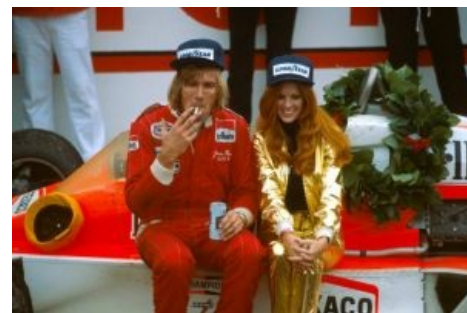
Трудовые будни Джеймса

Начинал карьеру в эпичной команде некоего английского лорда Хэскета. Изначально команда была запилена, видимо, ради лулзов, блэкджек и шлюхи прилагались. Прославились они в основном распитием шампусика и громкими тусовками в отелях с девками, причем бухали и веселились независимо от результатов гран-при. Однако лихач Хант сумел заработать в ней несколько подиумов и даже один раз выиграть, после чего ушел в Маки, где доставил прежде всего битвой с Лаудой, внезапно выигранным титулом и последующим скатыванием в говно. После гонок был комментатором на ВВС на пару с Мюрреем Уокером. Вел весьма бурный образ жизни: бухал, курил дурь, перетрахал кучу баб и вообще отжигал на полную, в итоге сердечко ему этого не простило и в возрасте 45 лет Хант принял ислам, причем через несколько часов после того, как сделал предложение одной тьян.