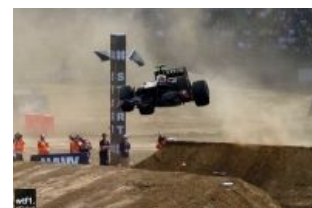
Троллинг с официального сайта Ренотуса после ГП Малайзии 2011.

В серии GP2 смог в 2009 занять второе место, что есть вин. В 2010 дебютировал в доставлявшей когда-то Рено с Кубицей в напарниках. Попал туда благодаря своему блестящему таланту... ну и n-ному числу миллионов Евро от папы, которому, за неимением на тот момент спонсоров, пришлось заложить квартиру и взять кредит. Но спонсор всё-таки нашёлся, и наклейку LADA на болиде Рено проплатил Рособоронэкспорт , что символизирует.