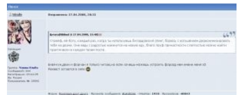
Флажок получил, что хотел

10.05.08 около 23.00 была сделана группа Вконтакте с целью сбора еще большего количества лулзов, повествующая о жестоких пользователях Лепры , заставивших мальчика унижаться, и призывающая связаться с родителями мальчика для предотвращения дальнейших издевательств над ним и совершения