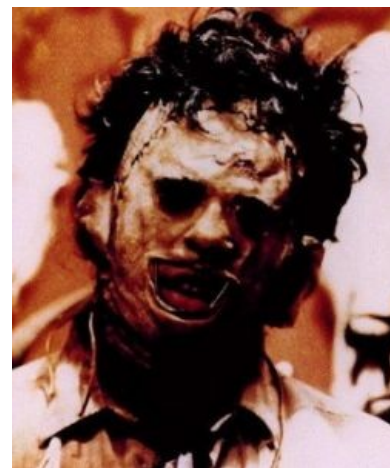
Кожемордый чему-то рад

В 1986 году Тоб Хупер снял вторую часть «Техасской резни» с Деннисом Хоппером в главной роли, который в финальном эпизоде ( спойлер : крушит бензопилой жилище б-гомерзких каннибалов, чем нереально доставляет!)