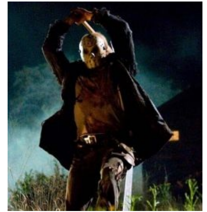
Джейсон Вурхиз вспахивает грядки

Композитор Гарри Манфредини признаётся, что большинство поклонников путают культовый звук в музыкальной теме фильма «ki-ki-ki, ma-ma-ma», слыша звуки «chi-chi-chi, ha-ha-ha». По задумке создателей, это эхо самого Джейсона, повторяющей миссис Вурхиз — «убей, мамочка» («kill-kill-kill, mom-mom-mom»).