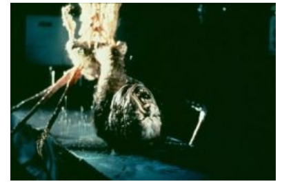
Неведомое инопланетное Нечто

Пиндосы же оставляют собаку у себя. Марш-бросок до норвежской станции с целью её обследования показывает, что изо льда был вырублен большой космический корабль (который норвежцы тоже нечаянно взорвали), а также кубик с гадским инопланетным оккупантом, который оказался слегка не готов к местным погодным условиям , вследствие чего неожиданно замерз, выйдя до ветру и не успев вернуться. Тут-то любопытные норвежские варвары естествоиспытатели его и взяли холодненьким, незамедлительно приволокли к себе да разморозили. По ходу выясняется, что неведомая хуйня, отойдя от криоконсервации , взбунтовалась, выпилила всех норвежцев, мимикрировала в собаку и сбежала. Квазипсина, будучи в загоне с остальными пиндосскими собаками, кусает одного из экспедиторов. После чего тот стал мутировать и потихоньку захавывать моски других экспедиторов. И так пока главный герой не захавал его. Хотя в фильме существуют две концовки, где в одной из них все люди погибают . А ведь пришелец всего лишь хотел заморозиться опять до окончания полярной ночи.