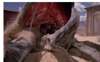
Местный грабид. Найди 10 отличий от Шай-Хулуд

Здесь речь идет в основном об итальянской каннибалистике режиссеров Руджеро Деодато и Умберто Ленци. В отличие от американского хоррора того времени, в этих фильмах отсутствовали типичные для голливуда подьбки и приколы, а внимание зрителя сосредоточено именно на гуро , в отличие от того же «Сияния», который смотрится просто как драма с парой кровавых сцен. Расчлененка выглядит вполне реалистично для того времени, да еще с учетом низкого бюджета самих фильмов, кое-что даже снималось по-настоящему (об этом см. ниже): итальяшкам было похуй на этику, что впоследствии вышло некоторым лишней жопоболью. Опционально присутствует рэйп , причем насилуют всех: от фапабельных белых девок (которых потом жрут) до аборигенок с обвисшими сиськами. В общем, фильмы смотрятся именно как ужасы, а не что-либо ещё, шокируя искушенных западных зрителей, что уж тут говорить про наших советских.