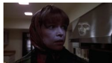
Сатана: When you see it, you'll shit bricks

Сюжет: С невеликовозрастной девочкой по имени Риган начинается всякая нездоровая хуйня. Мать, видя это, обращается к врачам, которые не замедляют с постановлением многочисленных диагнозов, и лечат девочку всем, чем только возможно. Однако же, никуя не помогает. И тут ВНЕЗАПНО мать начинает догадываться, что в девочку вселился демон!