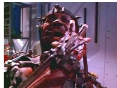
Нигра-зомби с пневмоприводом

Вторая половина семидесятых и восьмидесятые — золотой век ужастиков. С понятием «фильм ужасов 80-х» (или «дешевый ужастик 80-х») чаще всего ассоциируются: