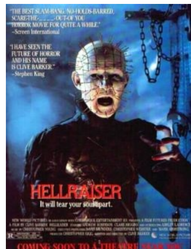
Тонкий британский хоррор