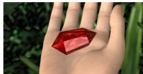
Философский камень в игре Shadow of Destiny

Поскольку оказалось, что даже при полной бесперспективности фундаментальной идеи (и отсутствии экономической выгоды) от самого процесса поисков и «работы над» можно и нужно получать сотни профита. И поныне юноши бледные со взором горящим и трясущимися от жадности руками в поте лица трудятся над разработкой искусственного интеллекта (видимо, не хватает собственного), красной ртути , нанотехнологий , фильтров Петрика и всяких других страшных слов. Как правило, не оставаясь в накладе .