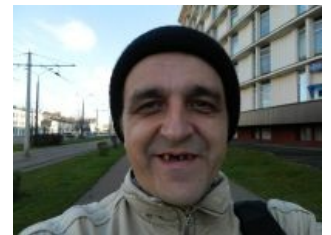
Per aspera ad astra