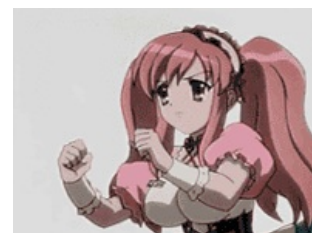
Кагбе разуплотняе флаере Ермакове!