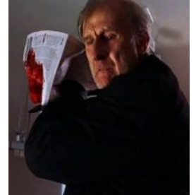
Пиратская версия Каллагэна обижает негров