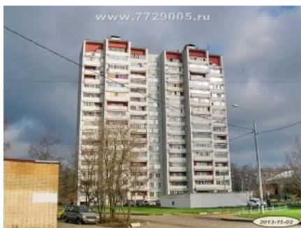
Тёмная башня 19-25