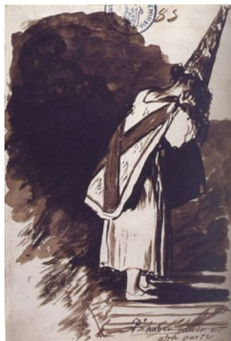
Санбенито — такая разновидность модной одежды, разработанной специально для еретиков.

Торквемада прославился преимущественно лютой ксенофобией. Расовая ненависть — единственная