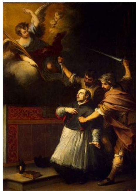
Копрофаги убивают Педро де Арбуэса

«Мы, брат Томас де Торквемада, монах ордена братьев-проповедников, приор монастыря Санта-Крус в Сеговии, духовник короля и королевы – наших государей, и генеральный инквизитор во всех их королевствах и владениях против еретической испорченности, назначенный и уполномоченный Святым апостольским престолом... »