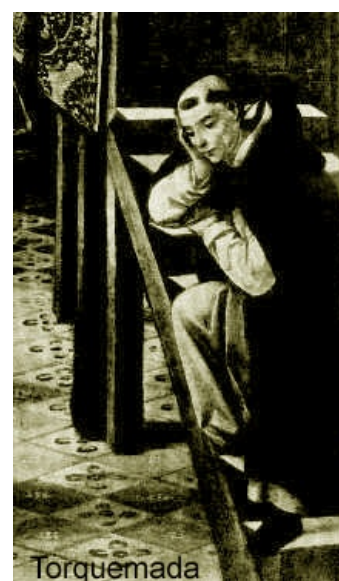
Torquemada Торквемада печётся за судьбы España natal