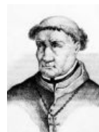
И в седой старости.