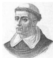
Сабж в мятежной молодости...