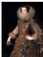
Изабелла I Кастильская