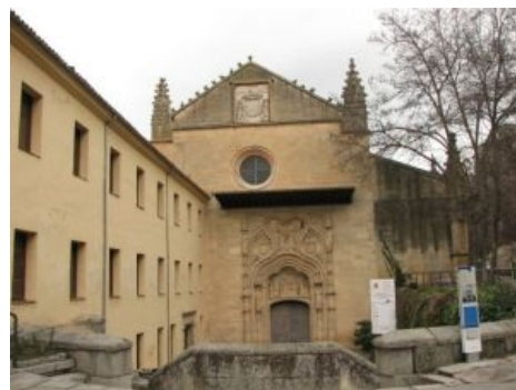
Монастырь Св. Томаса. Ноне перепилен

Однажды Торквемада уснул и не проснулся. Его похоронили в саркофаге, который был разрушен в 19 веке какими-то долбоёбами в знак протеста против террора. Либерасты, они такие.