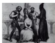
Некоторых еретиков душили специальной веревочкой. Не эстетично, зато дешево, надежно и практично.