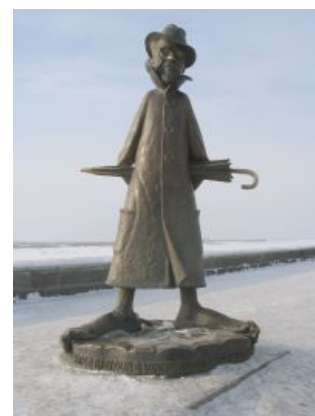
Томский Чехов такой томский